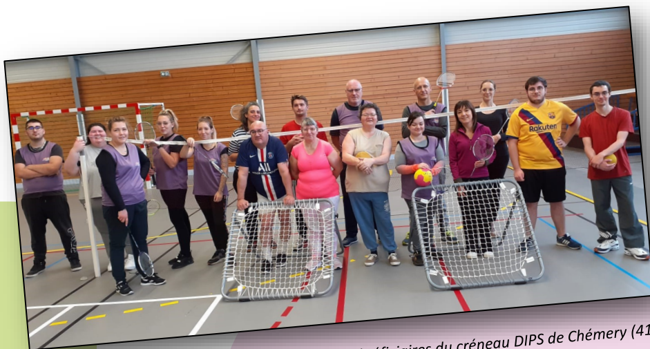
Bénéficiaires du créneau DIPS de Chémery (41)