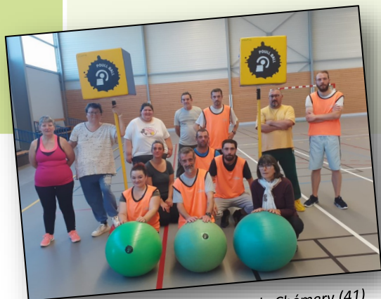
Bénéficiaires du créneau DIPS de Chémery (41)

« Pour la personne accompagnée, c'est se projeter et s'engager dans la séance chaque semaine, interagir avec d'autres dans un climat convivial et sécurisé , faire partie d'une équipe et s'y investir à la mesure de ses capacités .