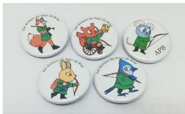
Badges Ø3.3cm Pv : unitaire : 0.80€ Pv : Le lot : 3€