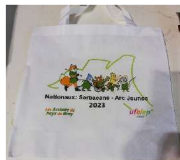
Sac shopping H 37cm- L40cm Anse 20cm Pv : 3€