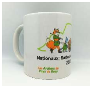
Grande tasse ultra blanche en céramique H9.5cm- Ø8cm Pv : 8€