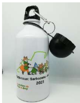
Gourde Alu. Deux bouchons H.18.5cm - Ø7.3cm- 500ml Pv : 10€