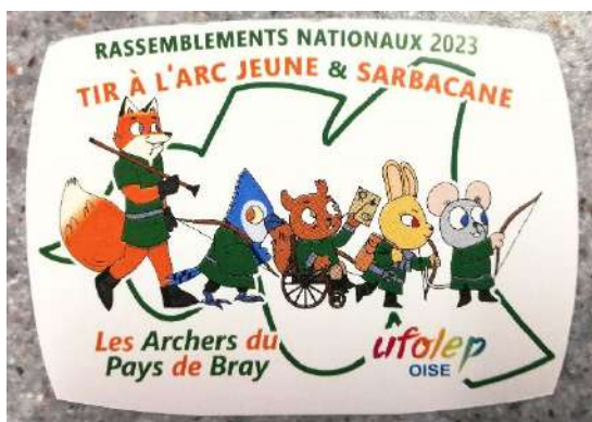
Autocollant ou feuille Magnétique ~6.5 cm x 8.5 cm Pv : 0.50€