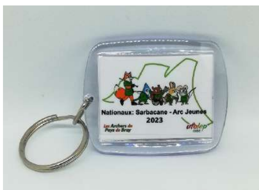
Porte clef. Impression recto / verso Pv : 3€