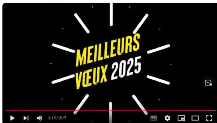
Rétrospective Ufolep 2024 - Voeux 2025